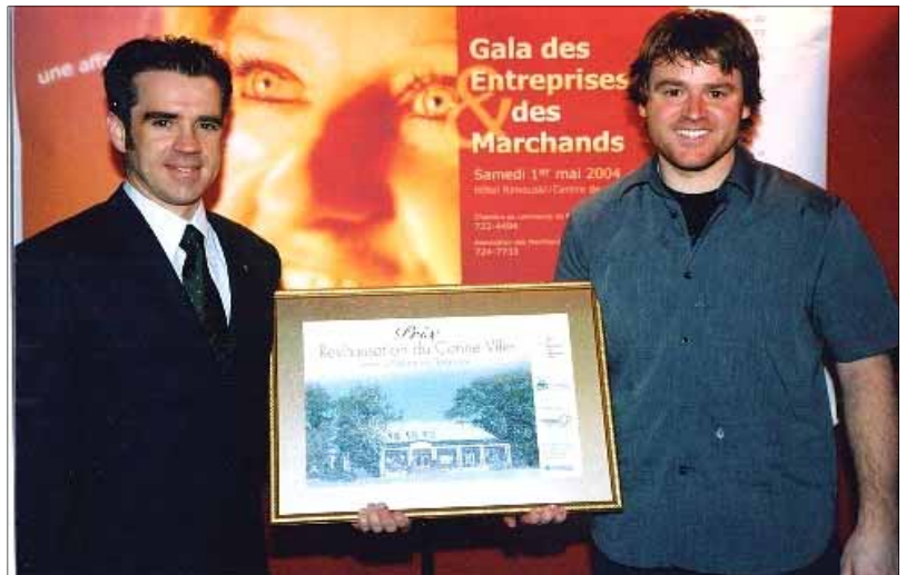
Divers événements visent à récompenser et encourager les entrepreneurs locaux

Avec le succès de la démarche de revitalisation, le centre-ville connaît désormais un accroissement des commerces et se voit conforté dans son rôle d'un des trois pôles les plus importants de Rimouski. Le centre-ville affiche un dynamisme marqué par l'installation de nouveaux services et commerces de détail. On constate une croissance du tourisme et les établissements déjà présents manifestent un enthousiasme certain pour l'amélioration de leur image et la restauration de leur immeuble. Il