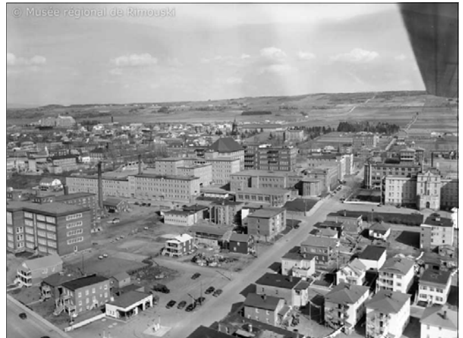
Rimouski dans la première moitié du XX e siècle

L'inquiétude des commerçants situés au centre-ville s'accroît avec la baisse de l'activité commerciale. La réaction des acteurs économiques ne se fait pas attendre.