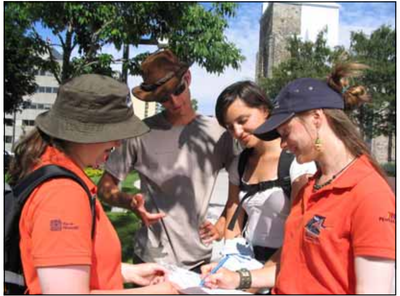
Les valets urbains contribuent à la création d'une atmosphère agréable pour tous les usagers du centre-ville

Le rôle des valets urbains est d'offrir un accueil chaleureux tant aux visiteurs qu'aux résidents, de les renseigner sur les nombreux attraits de la ville, de garder le centre-ville propre, de rendre service à toutes personnes le désirant et ce, gratuitement. Grâce à cette démarche, la ville de Rimouski se distingue par un accueil personnalisé et un service visant à répondre aux besoins des résidents et des visiteurs.