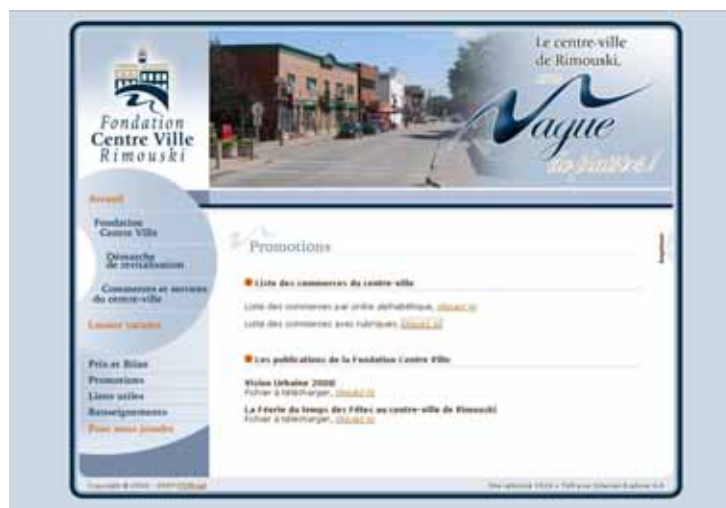
La création d'un site internet dédiée au développement du centre-ville est un outil de promotion commerciale important

Pour parvenir à cet objectif, plusieurs rencontres sont organisées avec différents types d'entrepreneurs. Ces démarches ont démontré à ces derniers la réelle collaboration établie entre les élus municipaux et les gens d'affaires locaux, dont l'objectif commun est la recherche d'un projet réaliste et bénéfique pour le centre-ville. Ce dossier, qui reste à finaliser, est un signe évident de l'attitude résolument proactive de la ville de Rimouski dans sa démarche de requalification de son centre-ville.