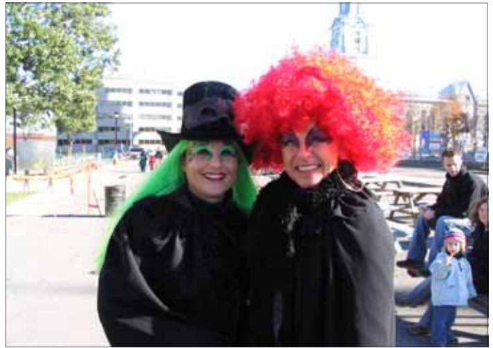
Le centre-ville a frissonné de plaisir lors de l'Halloween

Une ambiance carnavalesque, comprenant musique et décoration de circonstance, envahit chaque année le centre-ville, en attirant nombre de familles costumées à participer à la fête de l'Halloween. Cette activité familiale apporte au centre-ville une ambiance festive qui implique des marchands, distribuant des friandises, et des bénévoles costumés dirigeant le défilé qui parcourt la principale artère commerciale du centre-ville. Pour clôturer cette fête, les sorcières attendent les petits monstres avec des marmites fumantes de chocolats chauds, servis à la louche.