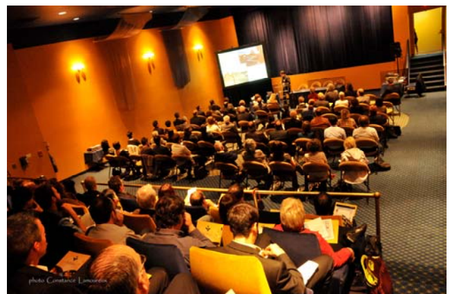
Des salles combles et de nombreux participants à l'écoute des conférenciers lors de ce 23ème Colloque annuel de la Fondation Rues principales.